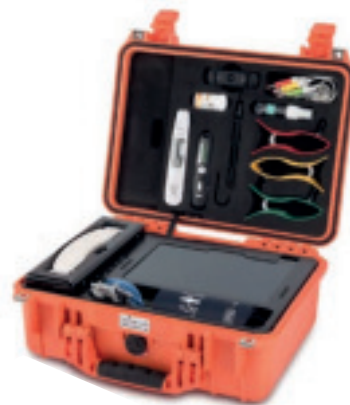
La station de télémédecine