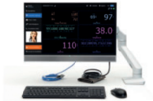
La station de télémédecine