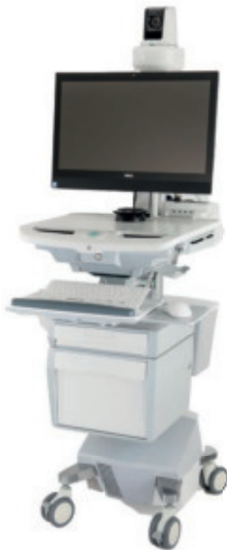
Le chariot de télémédecine